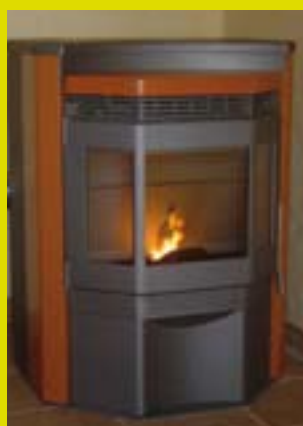
Poêle à granulés